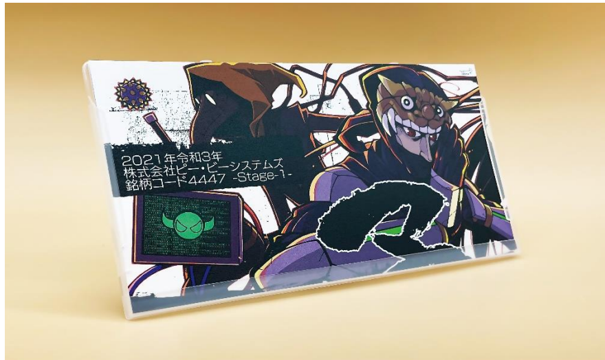
特製カレンダーの参考イメージ

(写真は昨年の株主優待品 特製カレンダー。実際のカレンダーは新たな描き起こしデザインになります)